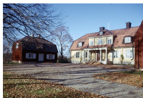
Hallunda gård 1964