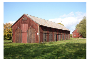
Gårdens ekonomibygnader 2009