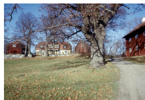
Hallunda gård 1964