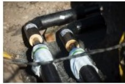
Fjärrvärmeledningar i marken.

För det andra bygger nuvarande lagstiftning på en grundtanke som de flesta svenskar ställer sig bakom: den fria marknaden med fritt tillträde. Att ”låsa in kunder” är ett undantag i en sådan marknad, och detta förekommer inte inom fjärrvärme (men däremot inom elmarknaden). I en fri marknad ska aktörer, om de är kommunalt ägda, agera på affärsmässiga grunder och inte skada den fria marknaden genom att underprissätta vissa tjänster. Villaägarnas Riksförbunds försök att ge de villaägare som har varit anslutna till ett fjärrvärmenät en särskild privilegierad ställning – där andra ska betala för deras fortsatta försörjning – är en helt främmande tanke i en fri marknad. Vi i Sverige värnar om den fria marknaden eftersom den gör att leverantörer tvingas vara konkurrenskraftiga, vilket leder till att kunderna får bättre och billigare produkter och att livskraftiga företag kan fortsätta vara det. Fjärrvärme är inget undantag och ska inte vara det i en tid då teknisk utveckling skapar helt nya möjligheter att till exempel värma villor med bergvärme eller solenergi och bränsleceller.