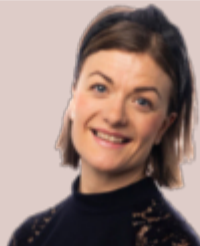
Stockholm i går